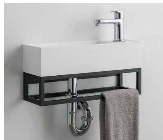
手洗い Type02 スチールタイプ