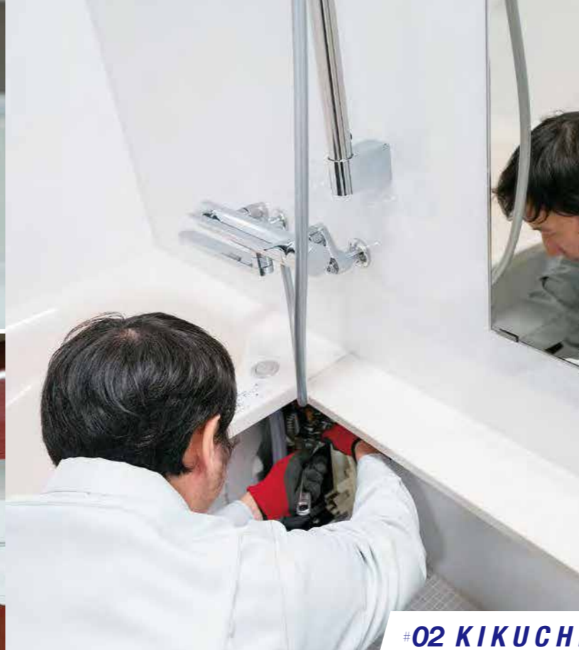
#02 KIKUCHI KOGYOSHO