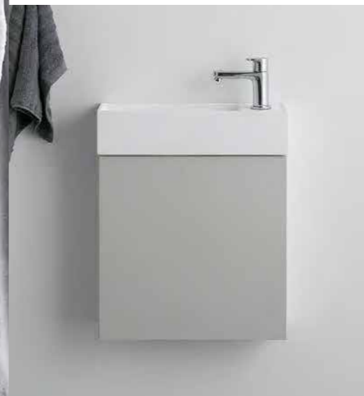
手洗い Type02 キャビネットタイプ