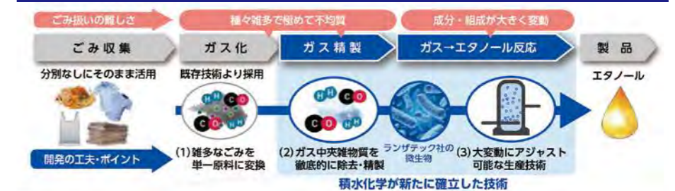
図：ごみ→エタノール変換技術

2023年ですが、原材料の高騰の影響など懸念材料はあるものの、住宅分野については昨年と同等か若干の持ち直し、非住宅分野では増加になるものと考えております。2023年も、メーカーの使命としてユーザーの皆様にご支持いただける製品の開発・提供に努める所存でございます。今後とも、小泉様を通じて、当社製品への変わらぬご愛顧を賜りますようお願い申し上げます。