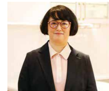
株式会社小泉 建設事業本部 エンジニアリング事業部 営業第二グループ 課長

小泉が手がける3ブランドの製品を、実際に見て、触れて、感じていただける場所になっております。多くのお客様と、ここでお会いできるのを楽しみにしています。ぜひ、アネックスショールームをお気軽にご活用ください。