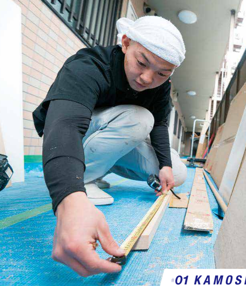
#01 KAMOSHITA KOGYO